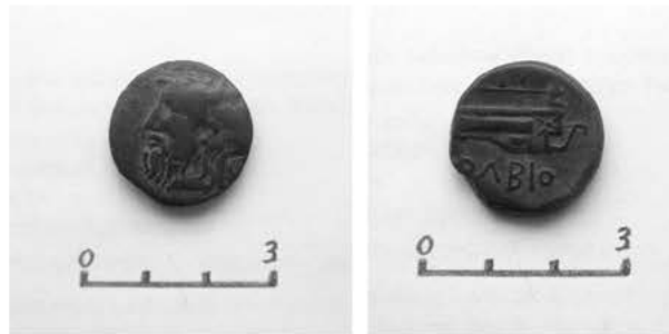
Рис.3. Монета «Борисфен» №1.