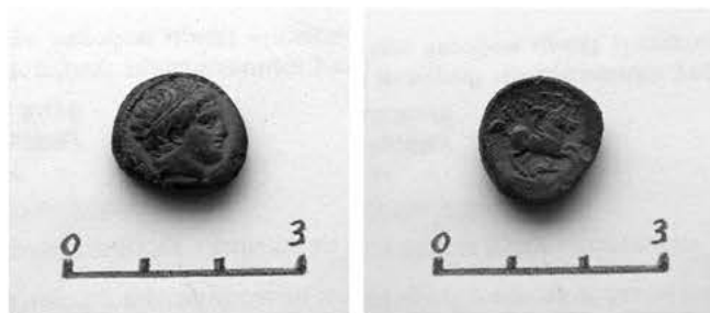
Рис.5. Македонська монета