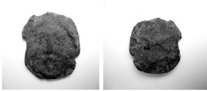
Рис.2. Монета «Ас».