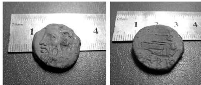
Рис.4. Монета «Борисфен» №2.