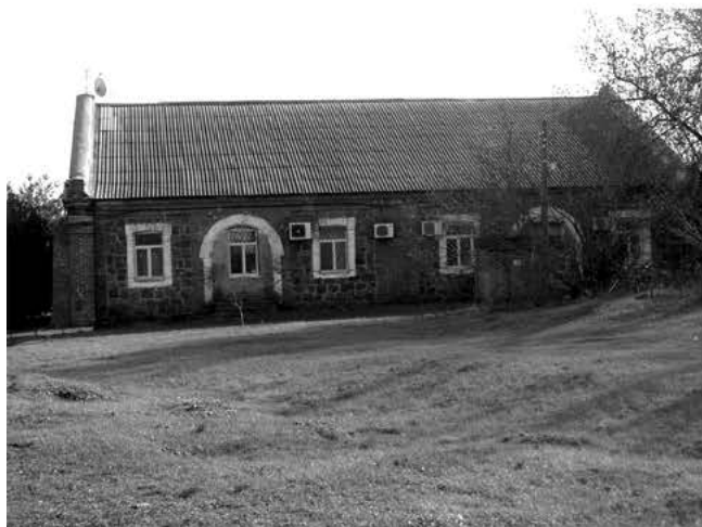
Рис. 2. Здание на Старой территории