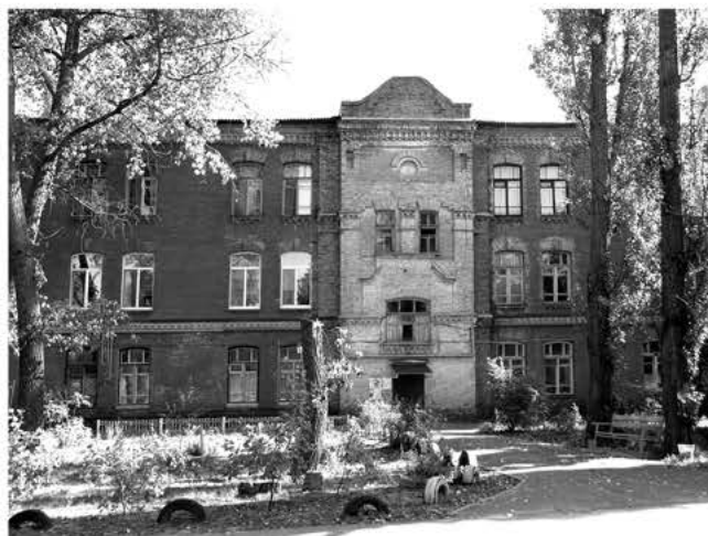
Рис. 3. Жилой дом на Новой территории.