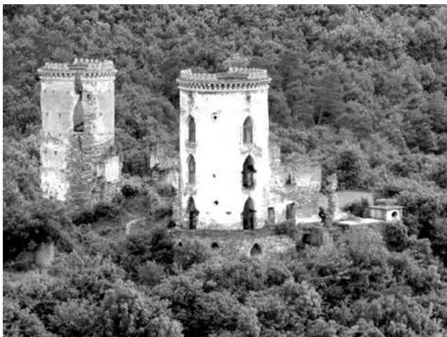
Рис. 1. Руїни Червоногородського замку.