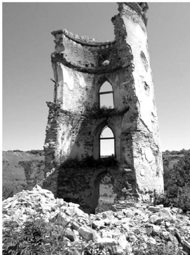
Рис. 4. Обвал вежі.