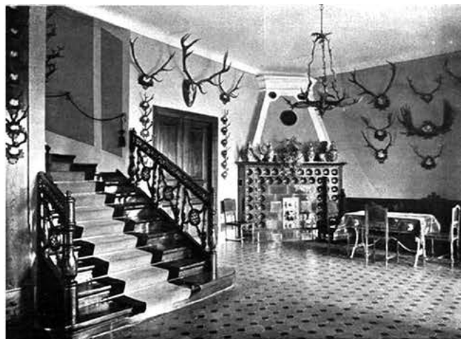
Рис. 3. Інтер'єр палацу.