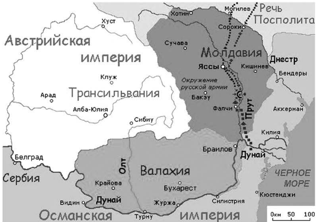
Рис. 2. Карта Прутського походу Петра I.