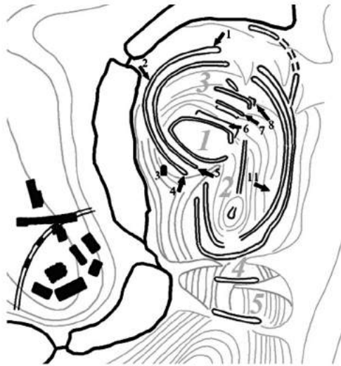
Рис.1. План Китаївського археологічного комплексу.