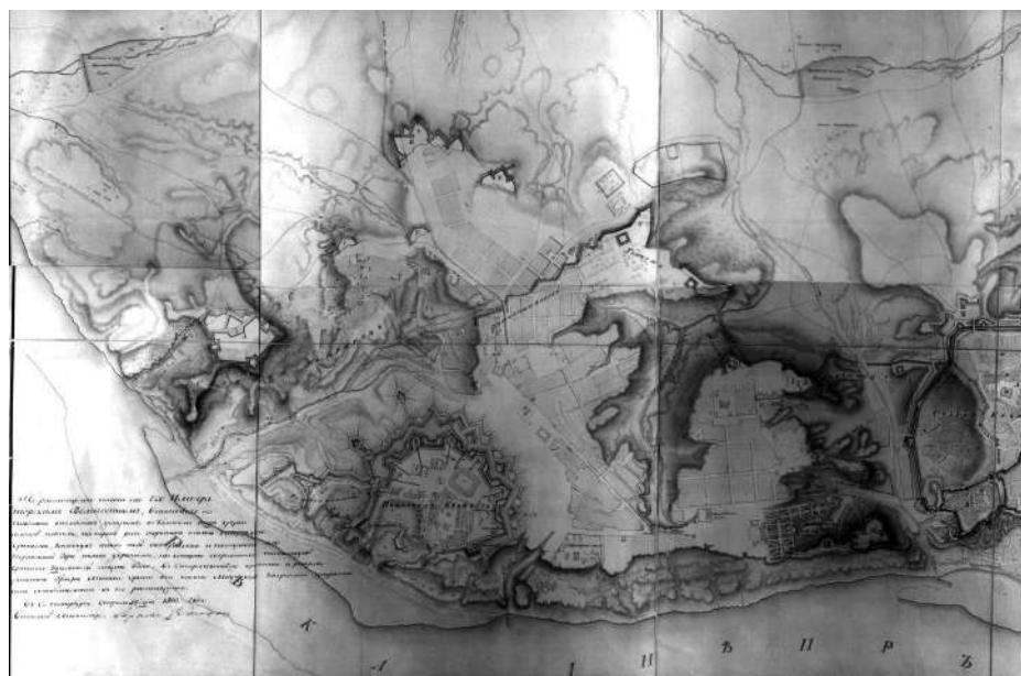
Рис. 1. Проект Оппермана 1810 р.