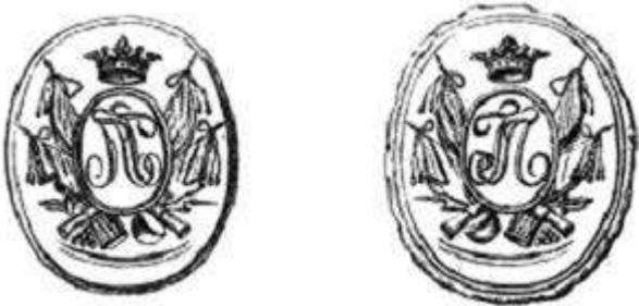
Рис. 2. Печать камер юнкера