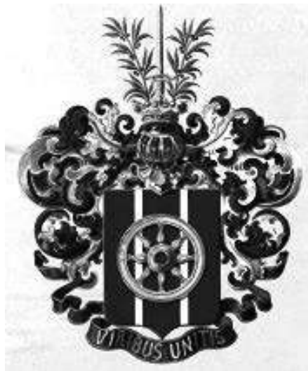
Рис. 4. Зображення гербу полковника Деана Суботича