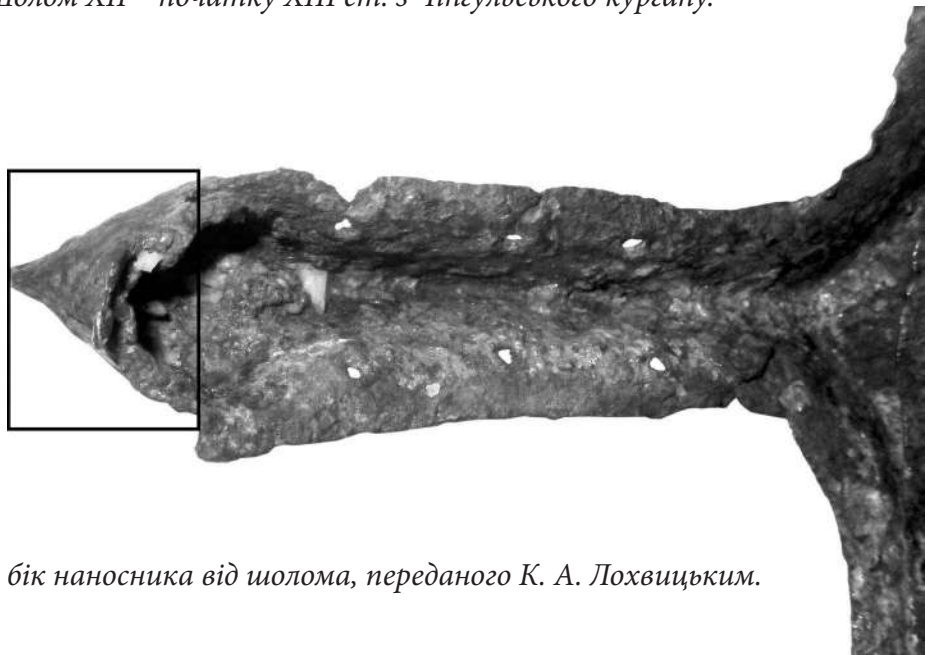
Рис. 8. Зворотній бік наносника від шолома, переданого К. А. Лохвицьким.