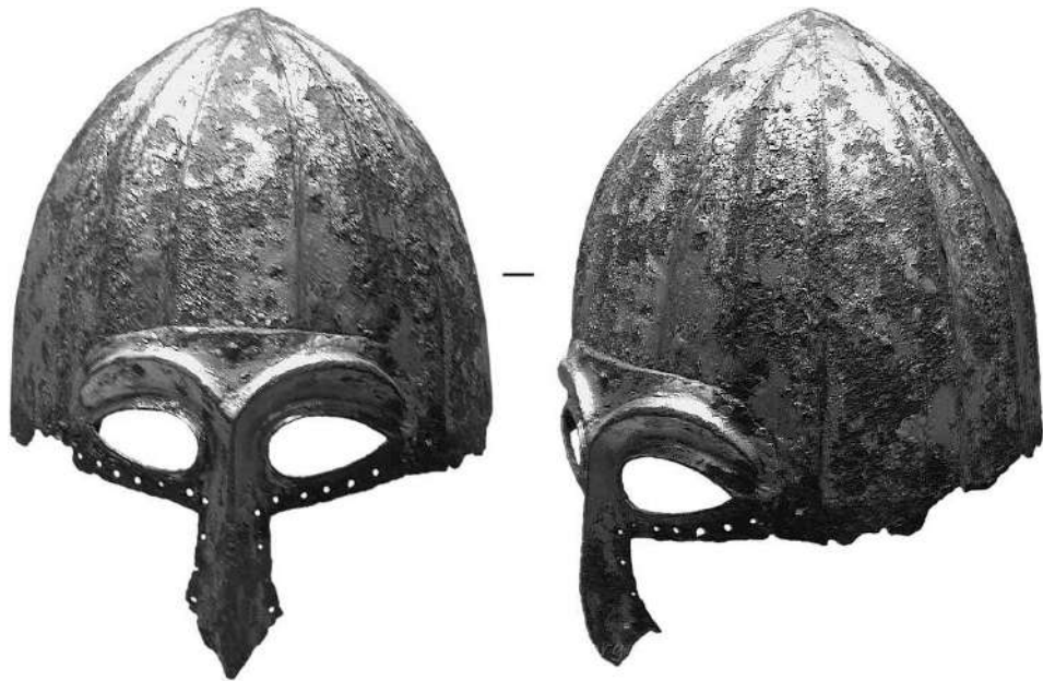
Рис. 6. Шолом XII – початку XIII ст., с. Никольське Орловської обл.