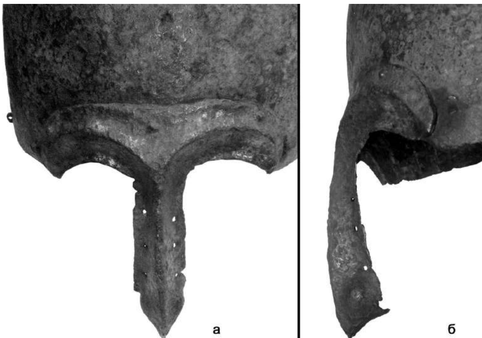
Рис. 5. Наносник шолому (фрагменти).