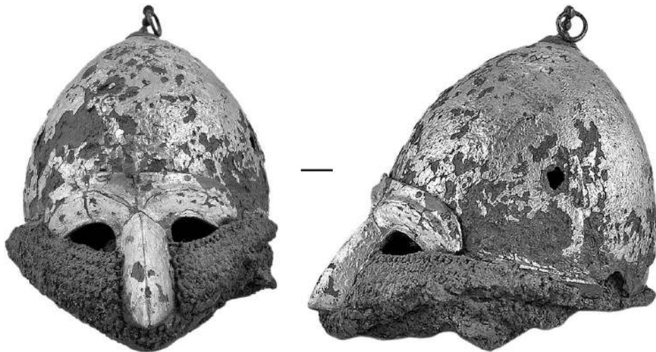
Рис. 7. Шолом XII – початку XIII ст. з Чингульського кургану.