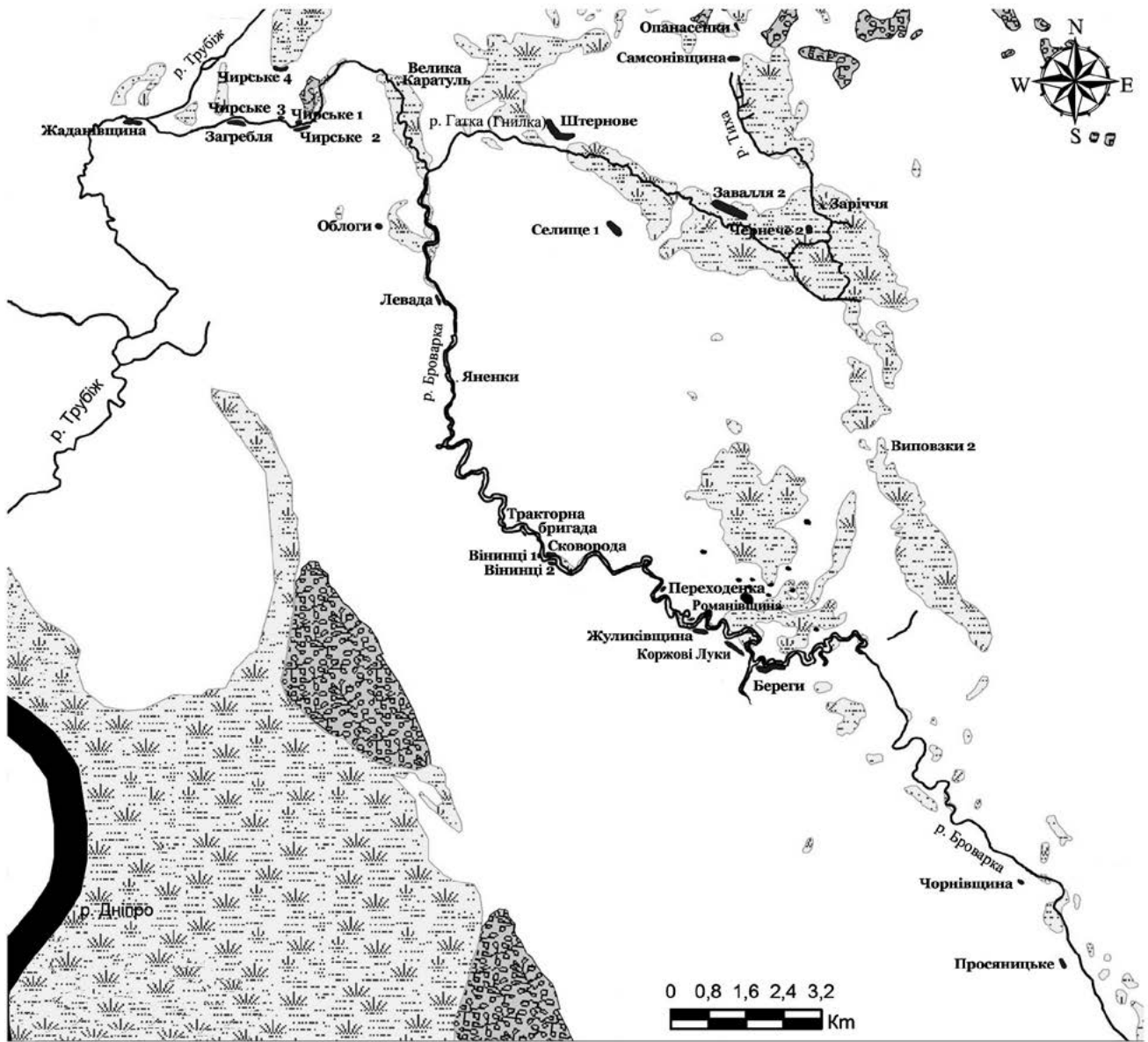
Рис. 4. Поширення ранньослов'янських пам'яток II-III ст. у долині р. Броварка.