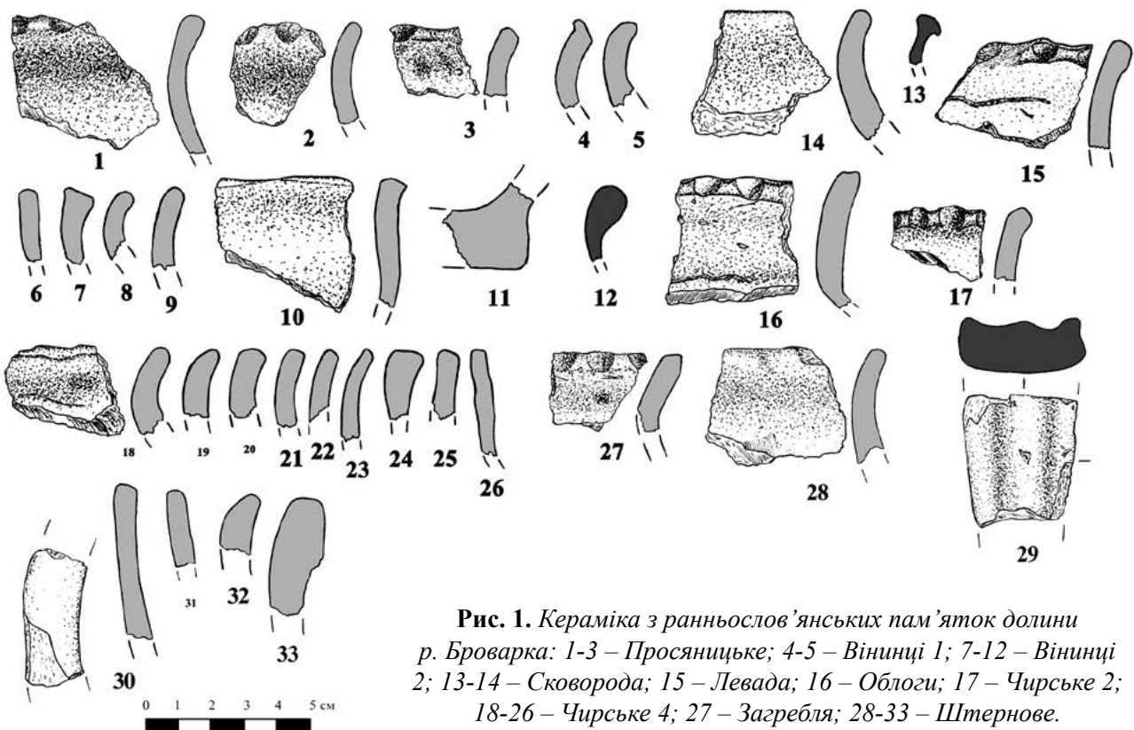
Рис. 1. Кераміка з ранньослов'янських пам'яток долини р. Броварка: 1-3 – Просяницьке; 4-5 – Вінинці 1; 7-12 – Вінинці 2; 13-14 – Скворода; 15 – Левада; 16 – Облоги; 17 – Чирське 2; 18-26 – Чирське 4; 27 – Загребля; 28-33 – Штернове.

ПХДІКЗ – Переяслав-Хмельницький державний історико-культурний заповідник. Переяслав-Хмельницький.