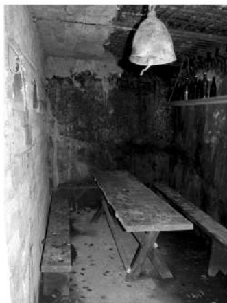
Фото 6. Інтер'єр в залізобетонній кухні в скансені «Старе село».