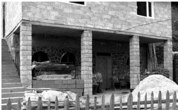
Фото 2. Залізобетонна кухня у селі Сойми.