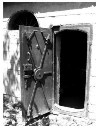
Фото 7. Металеві двері у відновленому залізобетонному медичному пункті.