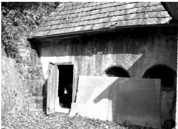
Фото 1. Залізобетонний медичний пункт у селі Вишка.