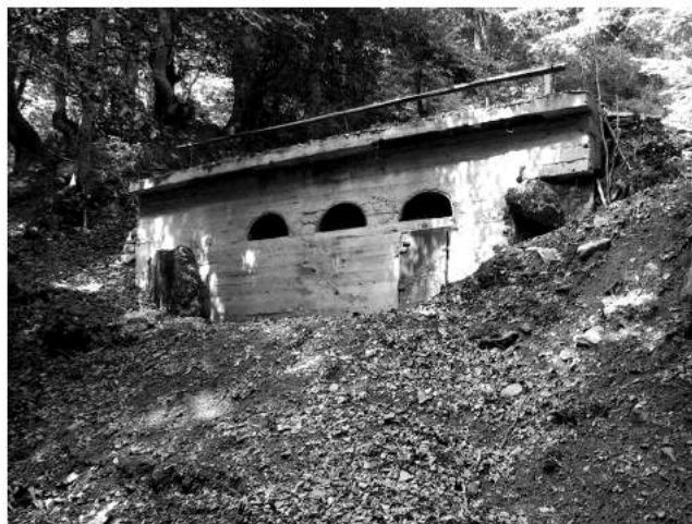
Фото 4. Відновлена залізобетонна кухня у селі Колочава.