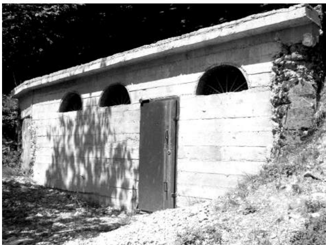
Фото 3. Відновлений залізобетонний медичний пункт у селі Колочава.