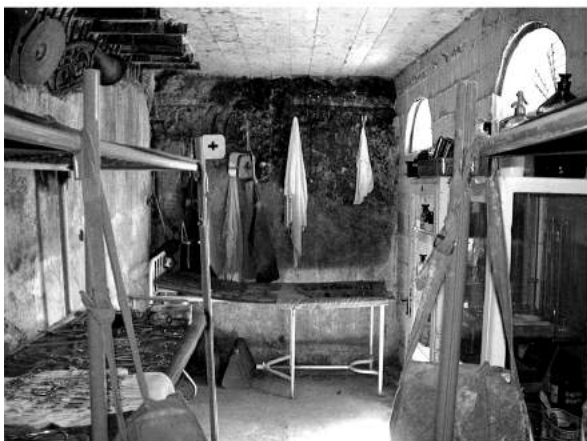
Фото 5. Експозиція у залізобетонному медичному пункті в скансені «Старе село».