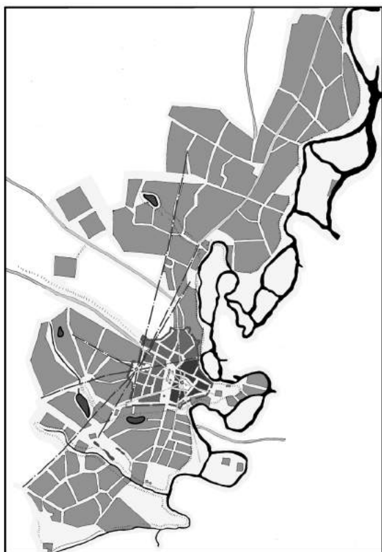
Мал. 3. Схема Самарчицького укріплення на сучасній топооснові міста Новомосковськ. 2016 р. Кресленник автора;