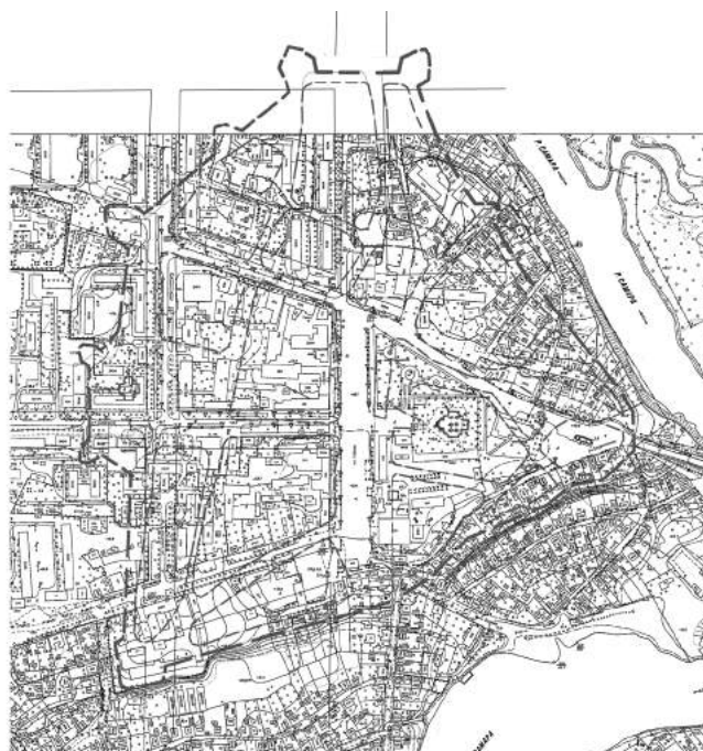
Мал. 2. Схема аналізу історичних картографічних джерел Самарчука-Новомосковська. Кресленник автора 2016 р.;