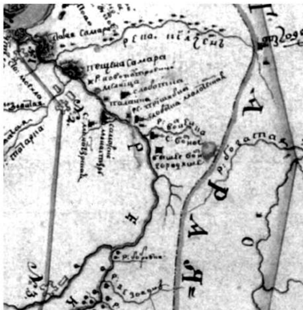
Мал. 1. Фрагмент «ландкарти между рек Днепра и Донца на расстоянии от Усть-Самары до Изюму и Луганской станицы». 1749 р.;