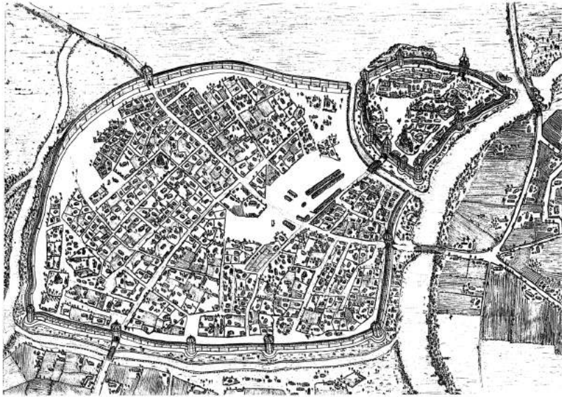
Рис. 2. Переяслав середини XVII ст. Реконструкція автора.