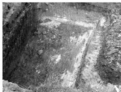
Рис.3. Розкопки слов'янського житла X-XI ст.