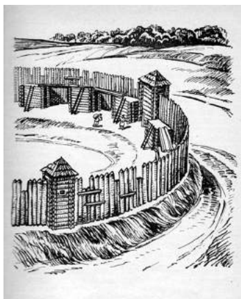
Рис.1. Дерев'яні укріплення

Грозинецького городища (малюнок-реконструкція худ. М. Молдавана)