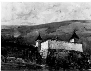
Рис.4. Хотинська фортеця XIII ст. (малюнки-реконструкції за Г.Н. Логвином)