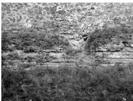
Рис.2. Фрагмент рову

Грозинецького городища (малюнок-реконструкція худ. М. Молдавана)