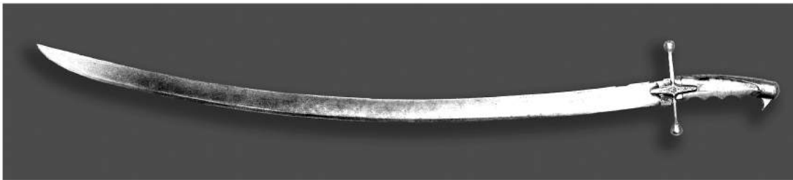
Рис.2. Шабля курінного отамана Івана Голинька Задунайської Січі. Загальний вигляд.