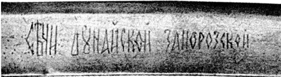
Рис.2а. Напис на лезі шаблі: «СЕЧИ ДУНАЙСКОЙ ЗАПОРОЖСКОЙ»