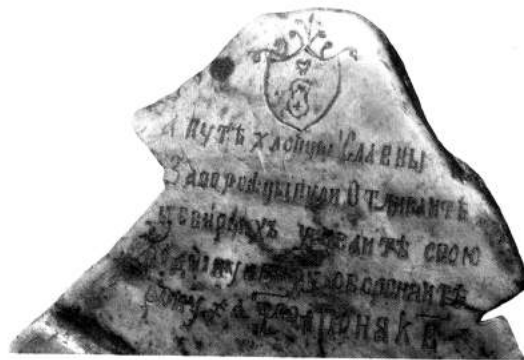
Рис.1а. Герб, напис та дата, вигравірувані на зовнішній поверхні виробу.