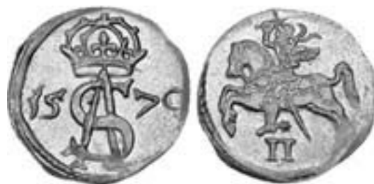
Рис. 5. Два динара. 1570 р.

Усі монети Сигізмунда II Августа, що представлені в експозиції «Історія грошей» Кам'янець-Подільського державного історичного музею-заповідника мають чималу інформаційну цінність для вивчення та аналізу, й потребують особливої уваги задля збереження їх для наступних поколінь.