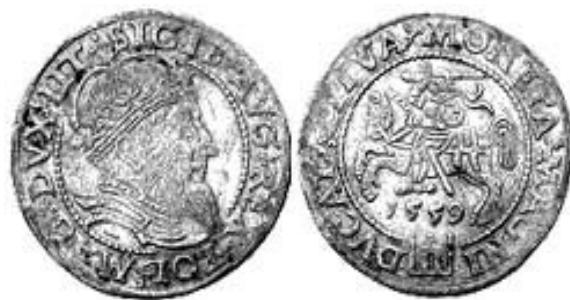
Рис. 2. Гріш по литовській стопі. 1559р.

усього XVI ст. Литовським грошам віддавалась перевага перед польськими не лише на українських землях, що входили до складу Великого князівства Литовського, а й на тих, на які поширювалась влада польських феодалів. Наприклад, 1551 р. польський король Сигізмунд II Август, щоб викликати довір'я у населення і полегшити складну справу заготівлі провіанту, наказав черкаському старості, щоб «служебніє наші ... живність купували пенезьми, на лічбу литовську платили, а не на лядську», тобто литовськими, а не польськими [3, с. 71].