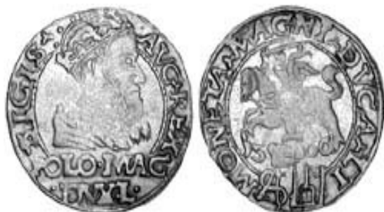
Рис. 3. Гріш по польській стопі. 1566 р.

Литовський гріш в експозиції музею представлений монетами 1559 р. та 1566 р. [4]. Гріш 1559 р. карбувався на Вільнюському монетному дворі по литовській стопі [7]. На аверсі зображено портрет Сигізмунда II Августа й навколо кругова легенда: «SIGIS.AVG.REX.POL.MAG.DVX.LIT.». На реверсі – герб Великого князівства Литовського – «Погоня», дата, внизу герб «Колюмна» розділяє кругову легенду в подвійному обідку: «MONETA.MAGNI – DVCAT.LITVA». В якості роздільних знаків використовується ластик. Вага монети – 2.43 грама [2, с. 44] (рис. 2).