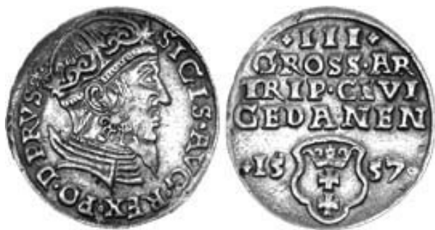
Рис. 4. Трояк Гданський. 1557 р.

(«DEI GRATIA» – «Божею милостію») – на монетах вільнюського монетного двору вони присутні, а тикоцинського – ні. Із обігу ці монети досить швидко вилучалися, так як користувалися популярністю за межами Литви (в Голландії їх називали «бородачами» – по портрету Сигізмунда). З 1562 р. було розпочато випуск іншого типу трояків – з монограмою (Вільно – 1562-1564 рр., Тикоцин – 1562-1563 рр. й 1565р.). Чвораки, що знаходяться в експозиції «Історія грошей» мають надщерблення та потертості. Усього є 6 монет, 4 з яких – 1566 р. й 2 монети – 1569 р. [5].