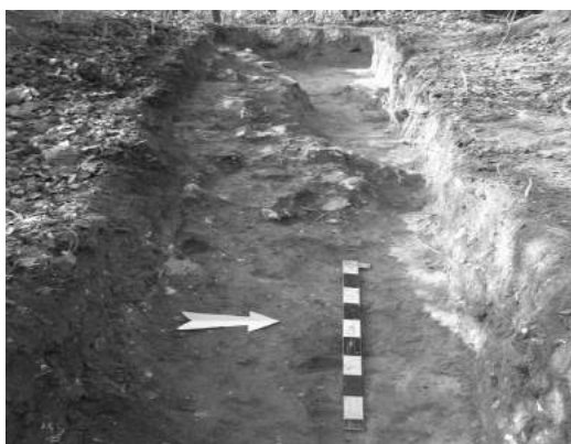
Рис. 3 Дослідження тераси під схилом замкової гори.