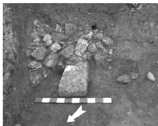
Рис. 2 Зачистка обвалу біля підніжжя західного схилу замкової гори.