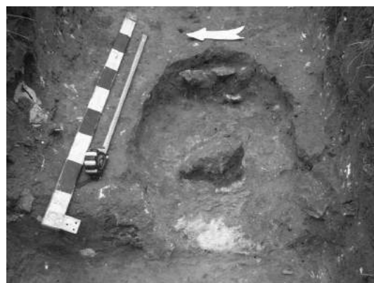
Рис. 4 Піч господарської будівлі в системі нижніх оборонних укріплень.