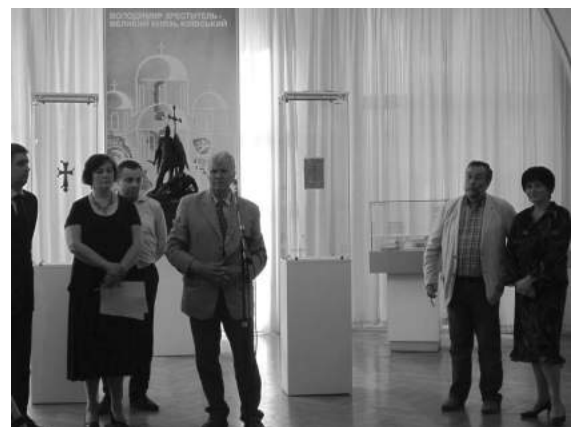
Рис. 3. Урочисте відкриття виставки «Володимир Хреститель – Великий князь Київський» 14 липня 2015р. Директор ІА НАНУ, академік П. П. Толочко розповідає про новітні археологічні дослідження на території Десятинної церкви.