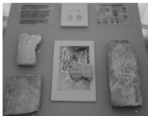
Рис. 4. Фрагменти плінфи з тризубами на виставці «Володимир Хреститель – Великий князь Київський»

В основі кольорового рішення виставки – світлі кольори: золотавий, зеленкуватий, білий, які створюють враження прозорості, великого об'єму, підкреслюють багатство експонатури. Схеми, анотації та етикетаж друкувалися на спеціальній прозорій плівці, яка не заважала загальному сприйняттю експозиції (рис. 4). Крім того, весь пояснювальний матеріал подавався