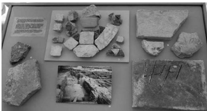
Рис. 5. Вітрина № 8 виставки «Володимир Хреститель – Великий князь Київський»: «Матеріали новітніх досліджень Десятинної церкви (фрагменти черепиці, мозаїчні плитки підлоги, плінфа)»

У вітрині № 8 були виставлені фрагменти черепиці та мозаїчної підлоги, будівельна плінфа різних форм і розмірів. Слово «плінфа» потрапило на Русь з Візантії, разом з майстрами-будівельниками, запрошеними князем Володимиром. У давньоруських письмових джерелах цеглу називали «плинфь». Вона виготовлялася з високоякісної глини і мала рівномірний випал. Спочатку