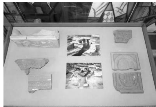
Рис. 1. Виставка «Десятинна церква. Новітні дослідження». Вітрина № 8: «Теракотові кахлі з рослинним орнаментом XIX ст.»

Матеріали новітніх досліджень стали в пригоді при створенні ще однієї виставки «Володимир Хреститель – Великий князь Київський» (14 липня – 30 вересня 2015р.), яку було присвячено 1000-річчю