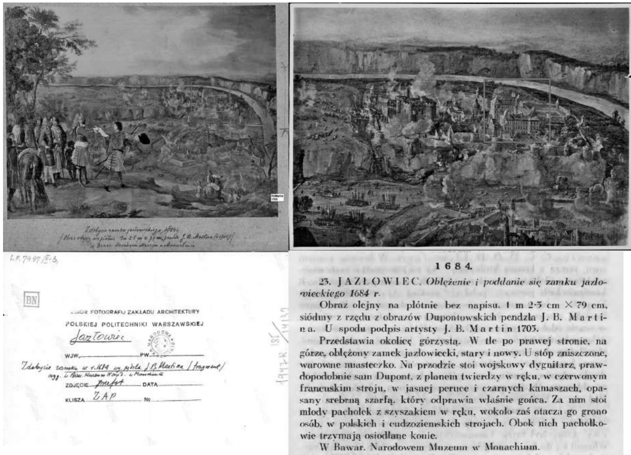
Рис. 1. Коллаж картини Мартіна та інформація про картину (НАС).

Стосовно автора картини, то необхідно відмітити, що в іконографії баталіста Жана-Батіста Мартіна згаданої картини немає, однак наші пошуки привели до ще одного відомого французького художника, П'єра-Деніса Мартіна, котрий був (за різними версіями) братом, двоюрідним братом або племінником Жана-Батіста. Англійська версія Вікіпедії зазначає, що обидва майстри працювали над новою серією робіт, «...які оспівували досягнення короля», завершеною у 1699 р. і виставленою у Шато-де Марлі [11]. Тут йдеться про короля Франції Людовика XIV, а цикл завершено у 1699 р. Дослідники могли переплутати «оспівування досягнень короля» Людовика з Яном III Собеським, але згаданий цикл було завершено у 1699 р., а картина «Визволення Язловця» була написана у 1705 р. (як зазначає підпис внизу полотна). Крім того, там же внизу є підпис: "PDMartin. 1705" (Рис.1).