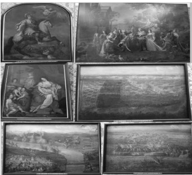
Рис. 3. Картини Мартіна. Фотоколлаж

Використання зазначеного іконографічного матеріалу Національного цифрового архіву (NAC) Польщі, а не оригіналу зображення, зумовлене рядом об'єктивних і суб'єктивних факторів. Кількарічні пошуки картин «Дюпонтівського циклу» привели нас до замку у містечку Шлясхайм неподалік Мюнхена. Тут, у так званій «Новій Пінакотеці», в галереї № 43 і знаходяться картини пензля Мартіна, що є предметом дослідження (Рис. 3, 4), хоча всі джерела подають Національну картинну галерею в Мюнхені. Фотокопії оригіналів полотен французького баталіста, виконані на наше прохання колегами-дослідниками, які відвідували Шлясхайм, мали ряд технічних огріхів. Випадково, саме досліджування картина «Визволення Язловця 1684 р» була скопійована невдало. Сподіваємось, що в скорому часі нам вдасться отримати якісну фотокопію оригіналу полотна.