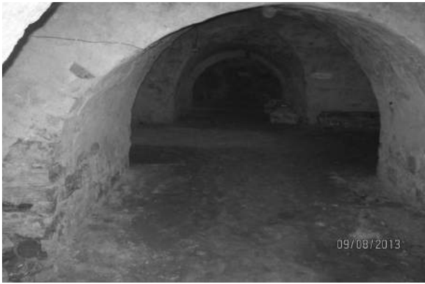
Фото 1. Центральна галерея підвальних приміщень костелу Святого Антонія