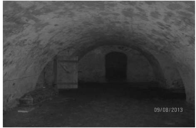
Фото 2. Підвальне приміщення під головним вітарем храму

Недалеко від костелу знаходився Тринітарський монастир (зараз православна церква Успіня Матері Божої), який також, кажуть, був з'єднаний з храмом підземними ходами.