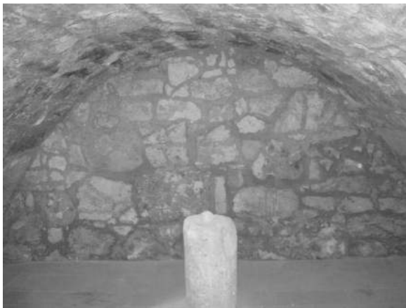
Фото 6. Підвальне приміщення під в'їзною вежею

Ціле перехрестя переходів та каналізаційних комунікацій можна побачити у фойє першого поверху замкового палацу [10, с. 5], (фото 11). Як відзначав у 60-х роках Ю. Негільовський, в кінці внутрішнього дворика, біля куртини, було знайдено широкий люк з ходами, що виконували функцію водозбору і водовідведення. Коли дощова вода з внутрішніх схилів даху по водостоках потрапляла у підземні каналізаційні комунікації і стікала у південно-східну фосу з тильної сторони палацу [15]. Ця підземна комунікація простягалась до 12 м. від зазначеного люку у північно-західному напрямку на повний зріст людини і повертала на 45° на північ у вигляді водовідного каналу [11, с. 123]. Зокрема на фото ми бачимо каналізаційний стік (фото 7), який простягається по під південно-східну стіну в сторону ескарпів і оборонного рову. Окрім даного стоку, під внутрішнім двориком існує ціла система розгалужених каналів різних розмірів. Центральний канал стоку мурований із каменю в ріст людини, що забезпечувало можливість його чистки [4, с. 234].