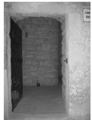
Фото 8 Замкова в'язниця

У похмурому підземеллі Збаразького замку недавно відкрилася нова експозиція, де зараз можна оглянути знаряддя тортур часу середньовіччя з Португалії, Іспанії, України, за допомогою яких в смутні часи катували відьом, ворожок, зрадників, брехунів і просто неугодних владі людей. Ідея створити кімнату тортур виникла ще декілька років тому. Перед цим наукові співробітники Національного заповідника «Замки Тернопілля»