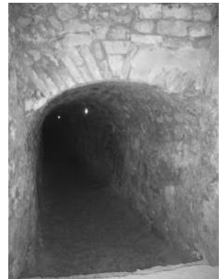
Фото 3. Хід до криниці замку

На сьогодні доступними для огляду є частина підземного ходу, що веде до криниці, з кожним кроком він опускається все нижче і нижче під землю і стає все меншим і меншим (фото 3). Вузкий хідник, обкладений тесаним каменем, довжиною понад 21 метр. Цей хід розчищений на віддалі 9 метрів від криниці. Над плесом води був спеціальний дверний підйом, звідки можна було зачерпнути її для потреб. Навіть під час довготривалої облоги оборонці фортеці могли користуватися водою із названої криниці [6, с. 7]. Зверху доступ до криниці був закритий, тому що берегли воду від забруднення, а при облозі від навмисного отруєння.