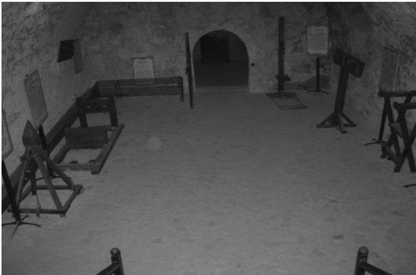
Фото 9 Кімната тортур

їздили переймати досвід у ті замки, де вже діють подібні експозиції. Зокрема, в замки м. Дубно та м. Луцька, а також в замках Франції та Польщі. Експонати до музею зробили майстри зі Збаража та Романового Села за старовинними зразками. Серед найстрашніших – гарота, «стілець відьми», пристрій для катування вогнем та металеві гаки, якими жертву підвішували за ребра. Найжорсткіші вироки інквізиція виносила у Франції, Південній Італії, Німеччині та Іспанії, але чи діяла католицька інквізиція на території сучасного Тернопілля, поки що невідомо й зараз встановити це доволі важко через брак джерел. Сьогодні кімната тортур викликає великий інтерес у туристів, хоча зважуються заходити до неї не всі [17] (фото 9).