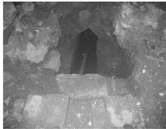
Фото 7. Каналізаційний стік

Безумовно мали б бути підземні ходи, що сполучали підземелля замку із зовнішніми куртинними укріпленнями та містом, але на даний час вони ще не досліджені. Найзагадковішою частиною підземелля є еліпсоподібна зала, де посередині збереглась велика колона з гаками для катувань людей [7, с. 11], (фото 8). Напроти підземного ходу до криниці є вхід котрим через малий «коридорчик» можна потрапити до «камери катувань». Ніхто зараз не стверджує, що це була камера катувань княжого часу. На думку більшості дослідників тут спочатку були гвинтові сходи в нижній ярус підземелля, до тих приміщень, які по під річку вели до центру міста, або, можливо, і до костелу Святого Антонія. Але після їх руйнації там було створено підсобне приміщення, а оскільки в радянський час західна оборонна стіна використовувалась як стрільбище, то у збережених підземеллях замку могла і бути кімната допитів НКВС. На жаль, жодна з вищеназваних версій використання цих підземних приміщень сьогодні не вивчається цілеспрямовано. Але цілком імовірно, що, краще дослідивши підземні ходи міста і замку, вдалося б знайти відповідь на безліч запитань і відтворити цілісну картину історії краю.