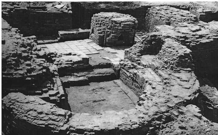
Рис.1. Церква Івана Богослова під час археологічних досліджень. 1985р.

Війна та післявоєнний період надовго затримали розвиток археологічної науки. Історико-археологічні дослідження Луцька були повністю згорнуті майже на тридцять років, частково внаслідок створення у 1939-1941 рр. концентраційного табору на території Старого міста, а також у зв'язку зі складним процесом становлення і утвердження радянської системи на Волині та проникнення її у всі сфери життя суспільства [18, с. 88]. Необхідно зауважити, що німецька окупаційна влада при виборі місця власних концентраційних таборів «скористалася здобутками» влади радянської також влаштувавши свої Шталаги №360/Z та 365/Z в тому числі і на території замку. По війні, незважаючи на взяття пам'ятки на облік наказом від 25 вересня 1945 року [6], вона залишалася в досить плачевному стані. Дослідження на території Старого міста у Луцьку стали можливими наприкінці «хрущовської відлиги», після ліквідації тюремного закладу 1963 р., однак самого Верхнього замку вони не торкалися ще довгий час [18, с. 111].