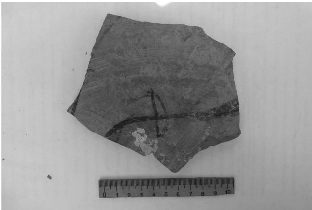
Рис. 5. Фрагмент горщика із зображенням лука чи півмісяця з розкопок на вулиці Зарванській, 7/1