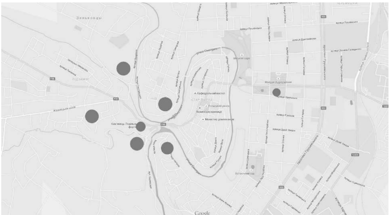
Рис. 3. Знахідки Трипільської культури в інших мікрорайонах Кам'яця-Подільського