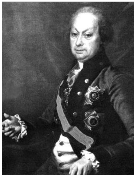
Рис. 1. Портрет О.П. Мельгунова

Ця пам'ятка, рештки якої розташовані сьогодні біля села Копані Знам'янського району Кіровоградської області, входить й до числа найперших досліджених археологічних об'єктів у Європі та світі загалом. У часі його розкопки йшли за такими першими кроками світової археології як дослідження першої половини – середини XVIII ст. у Геркуланумі та Помпеях в Італії. Вони передували великим відкриттям О. Марієта та Г. Масперо в Єгипті, Р. Кольдевея в Вавилоні, А. Еванса на Криті та багатьом іншим.