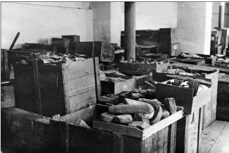
Рис. 3. Матеріали в ящиках у мокрих підвалах

характеризували стан зберігання матеріалів. Серед них габаритний посуд, розміщений на підлозі (2 фото) (Рис. 2); експонати, упаковані в дерев'яні ящики (Рис. 3), волога стіна з плямами «грибка», трипільські посудини з пророслими колосками жита, до цього додавався сам засушений колосок (Рис. 4).