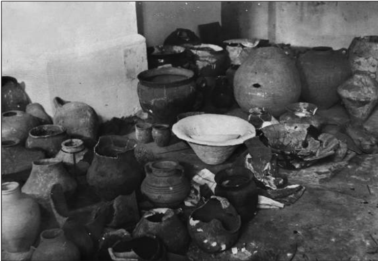
Рис. 2. Посуд, що зберігався на підлозі