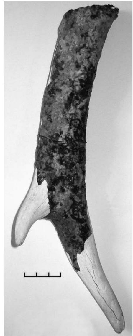
Рис. 5. Жванець. Фрагмент рала з рогу оленя. Розкопки 1969 р.