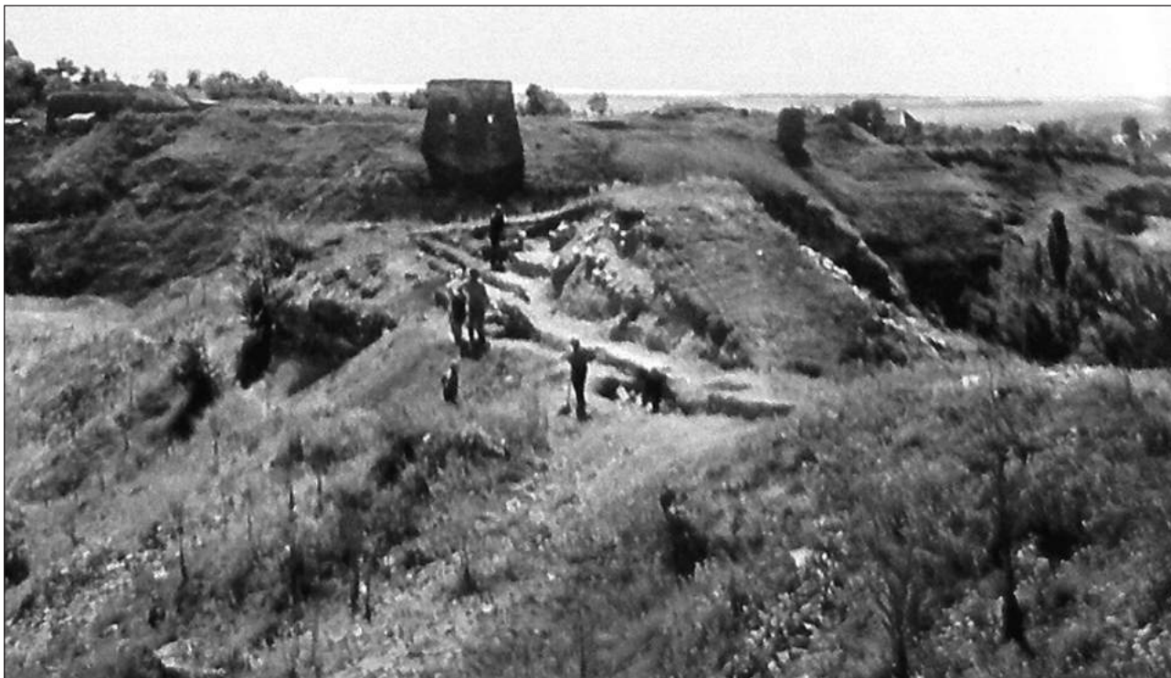
Рис. 1. Жванець-Лиса Гора. Розкопки валу трипільського городища. 1973 р.

рядами частоколу. З напольного боку в урочищі Лиса Гора розкопані два різночасові рови глибиною близько 3 м, що значно підсилювали фортифікаційну міць городища. Виявлені під час розкопок матеріали дозволили датувати оборонні укріплення етапом СІ [3; 5, с. 311].