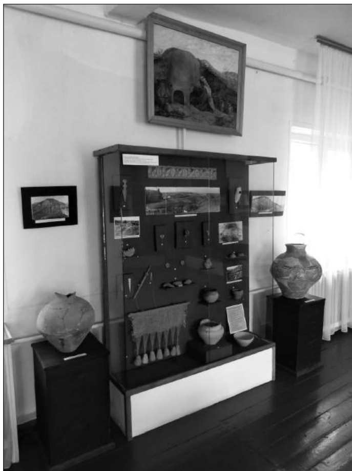
Рис. 2. Матеріали з поселення Жванець в експозиції Музею трипільської культури. 2014 р

У 1978-79 рр. на пізньотрипільському поселенні Жванець-Щовб було розкопане велике трикамерне наземне житло, розміром 20×5,7 м, з кам'яними та глинобитними конструкціями (рис. 3). Розкопками виявлено велику кількість кам'яних брил, дрібного каміння та глиняної обмазки, що навело дослідників на думку про використання каменю як фундаменту і основи стін будівлі. Для міцності кріплення дерев'яних стовпів, які тримали конструкцію, були використані великі камені сланцю, що утворили своєрідні гнізда. Вздовж східної сторони житла збереглося вісім таких кам'яних гнізд, зафіксовані вони й з торцевої сторони. Каміння застосовувалося також для огорожі робочих місць в інтер'єрі: у житлі плоскими камінцями, покладеними на ребро, було відділене місце, де, певно, стояв ткацький верстат [7, с. 18-19; 8, с. 239; 1, с. 11]. Виявлені на цьому місці керамічні грузила-відтяжки використані у відтвореній реконструкції вертикального ткацького верстата (рис. 2). Разом з глиняними пряслицями, кістяними голками, проколками та відбитками тканин на денцях посудин репрезентують в експозиції музею ткацтво трипільських племен.