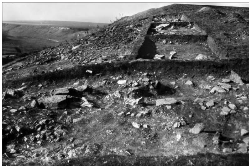
Рис. 3. Жванець-Щовб. Розкопки наземного житла. 1978 р.