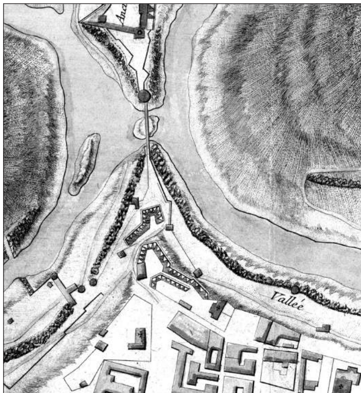
Рис. 2. Фрагмент плану Кам'янця-Подільського 1753 р.

Поряд з цим опис міста 1700 р. показує, що до появи військових об'єктів ділянка використовувалась під житлобудування міста. У північній частині ронделю розміщувався палац та садиба Конецьпольського, а південну його частину займав монастир Босих Кармелітів. Вважається, що орден Босих кармелітів з'явився у Кам'янці 1623 р. На цій території у 1638 р. було завершено будівництво монастиря та костюлу в ім'я св. Терези та св. Йосипа, а пізніше переосвяченого в ім'я Діви Марії та св. Йосипа [10, с. 158-161].