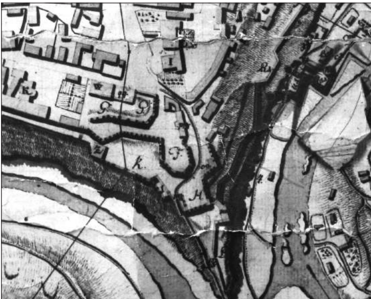
Рис. 4. Фрагмент плану Кам'яця-Подільського 1773 р.

можна прослідкувати за планами кінця XVIII – початку XIX ст.ст. Зміни ці більш стосуються огороження арсеналу. Так у північній стороні зводиться подвійна кам'яна стіна, що утворює коридор з двома ворітьми для проїзду на територію Високого ронделю [7, с. 19, 21]. На планах 1800 р. [15] та 1810 р. [16] укріплення Високого ронделю позначені як «батарея з кам'яною стіною та амбразурами», що дає нам певне уявлення про конструкцію укріплення. Кам'яні амбразури мали склепінчасте перекриття й вертикальні стінки щік. Внутрішній квадратний отвір амбразури визначався від 1,5 до 2,0 фути ( \approx 45,0-60,0 см), а зовнішній – від 3,0 до 5,0 футів ( \approx 90,0-150 м) [1, с. 343-344].