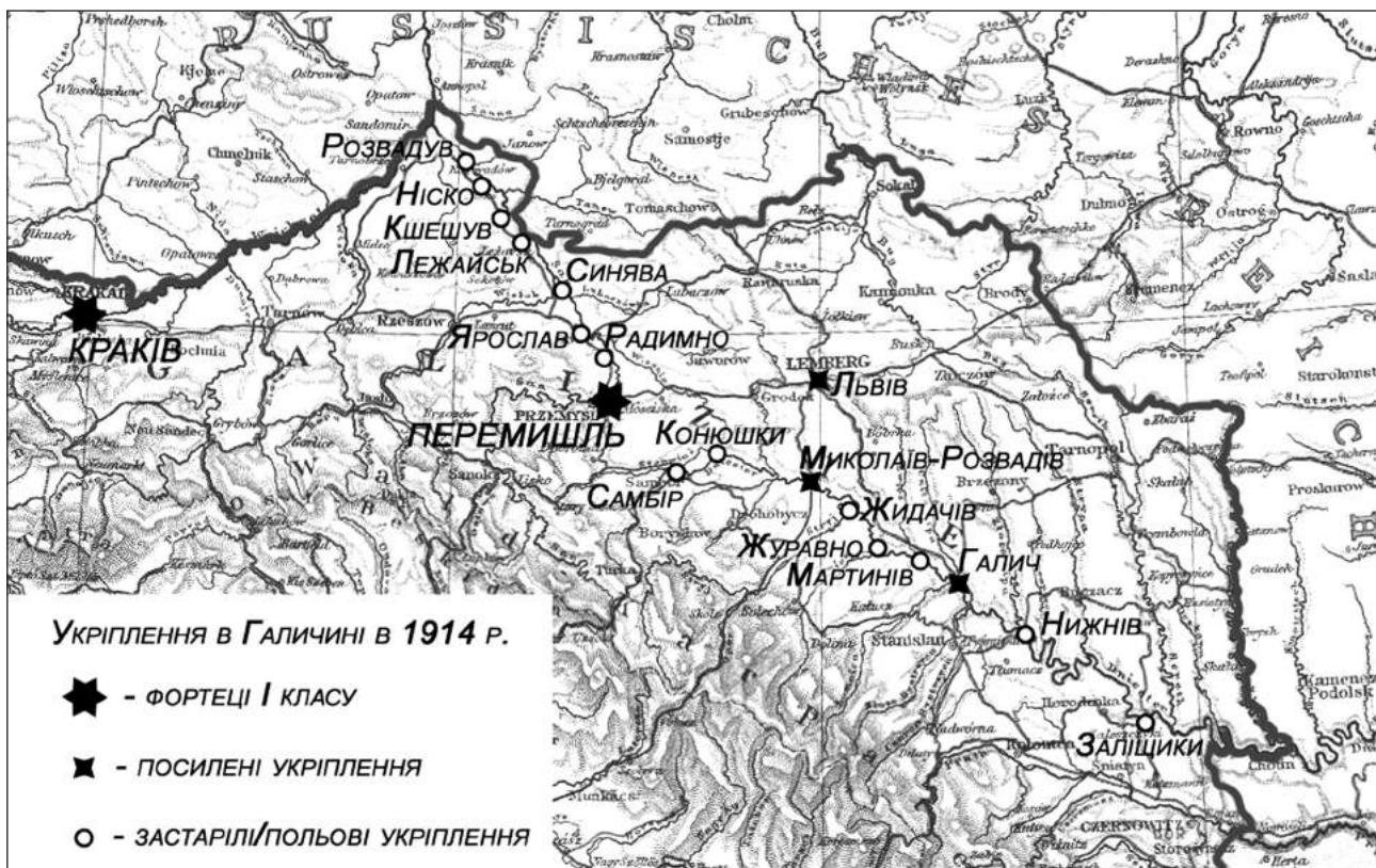
Карта 3. Укріплення в Галичині в 1914 році