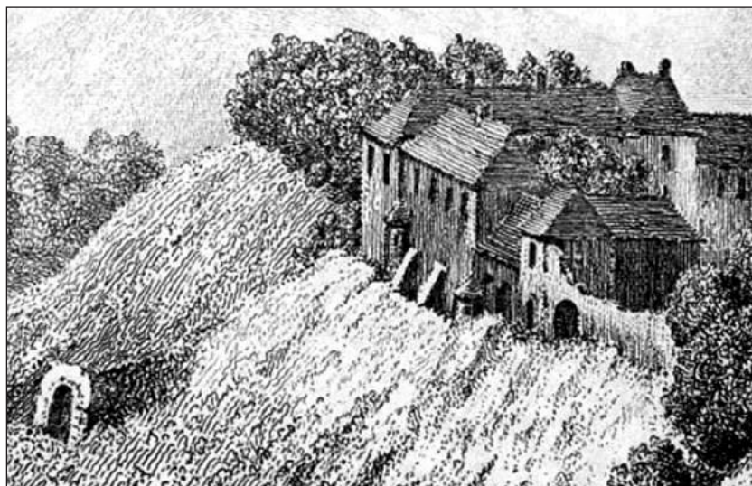
Рис. 2. Підземний хід Язловецького замку

Михайло Михайлович Вишневецький 1598 р. придбав у подружжя Чорторійських належну йому частину Вишнівського замку й Нове місто Вишневець із передмістям Муховець та приміськими селами Загороддя, Лози, Бодаки. У згаданому вище дільчому листі в частині князя Михайла вказані новозбудований Вишневецький замок , половина міста Новий Вишневець та 15 сіл. Вказаний замок у Новому Вишнівці збудований перед 1598 р., тобто, десь на початку – в другій половині XVI ст.