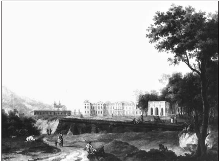
Рис. 4. Вишнівецький замок XVIII ст. (акварель невідомого автора)

У передмові до публікації тексту тестаменту Яреми Вишневецького у «Місячнику геральдичному» № 4, за липень 1930 р. доктор історії Владислав Томкевич зазначає, що після здобуття турками Вишнівця і руйнування замку в 1672 р. останній «спочивав в руїнах» більше півстоліття і лише в 1730-1740 рр. на його місці останній з Вишневецьких Міхал-Сервацій збудував новий замок в стилі Людовіка XIV [26, с. 68]. На малюнку невідомого автора XVIII ст. зображено залишки оборонних конструкцій північно-західного бастиону з окремими контрфорсами (Рис. 4).