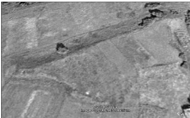
Рис. 6. Село Яснозір'я Віньковецького р-ну. Земляне укріплення (замчище) поч. XVII ст. Місцезнаходження об'єкта з космічної зйомки Google earth (Фото)

Чотири бастіони і вали укріплення насипані у формі прямокутника площею 1 га (Рис. 5-6). Замчище витягнуте з північного сходу на південний захід. Довжина 135 м, ширина у центрі 45 м. Бастіон №1 розташований у південно-західній частині замчища, довжиною 15 м, шириною 4 м, висота – 4 м. З'єднаний по пагорбу з редути № 2 та № 4 ескарпованими (підсипаними землею) валами довжиною відповідно 135 м та 75 м. Бастіон №2 розташований з південної сторони замчища, довжиною 15 м, шириною до 10 м, висотою 3 м. З'єднаний валом завдовжки 80 м з бастіоном № 3. Бастіон №3 довжиною 10 м, шириною 20 м, висотою 4 м. З'єднаний насипним валом завдовжки 76 м з редутою №4. Насипний вал між бастіонами №3 та №4 підсилений зовнішнім ровом. Бастіон №4 довжиною 7,4 м, шириною 4 м, висотою 4 м. (Рис. 7-8). Поруч замчища простежується культурний шар пізньюсередньовічного поселення.