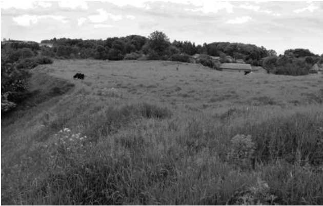
Рис. 7. Село Яснозір'я Віньковецького р-ну. Земляне укріплення (замчище) поч. XVII ст. Майданчик. Праворуч – бастион № 3. Вид з південного заходу (Фото)