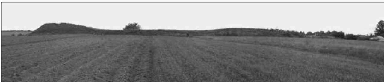
Рис. 5. Земляне укріплення (замчище) поч. XVII ст. у с. Яснозір'я Віньковецького району. Вид з півдня (Фото)

Замчище розташоване у західній частині села на високому пагорбі. З західного його боку протікає безіменний струмок, з півдня прокладена польова дорога, з інших сторін розташовані присадибні ділянки жителів села. На південний схід від укріплення стоїть каплиця XIX ст.