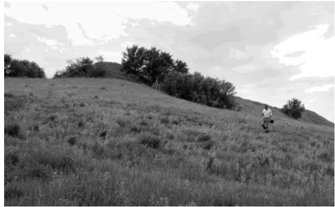
Рис. 8. Село Яснозір'я Віньковецького р-ну. Земляне укріплення (замчище) поч. XVII ст. Північна ділянка валу і схил мису. Праворуч – бастион № 1, ліворуч – № 4. Вид з північного сходу (Фото)