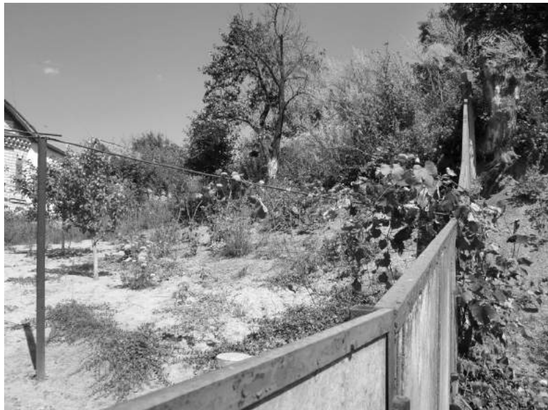
Рис. 3. Деражнянський замок. Північний рів та вал замку (Фото)