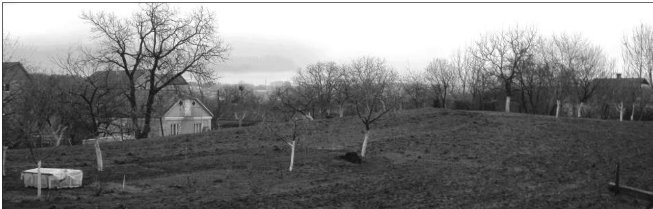
Рис. 1. Ярмолинецький замок. Східний бастион (Фото)

У 2011 р. В.Захар'єв виявив залишки ярмолинецької фортеці (Рис. 1). Вони розташовані майже в центрі теперішнього селища міського типу між Хмельницьким шосе та вулицею О.Кошового [13]. На основі проведених археологом обстежень хмельницький художник В.Юрчак зробив макет укріплення, який автори подарували для експонування у місцевому історико-краєзнавчому музеї району (Рис. 2) [14, с. 37].