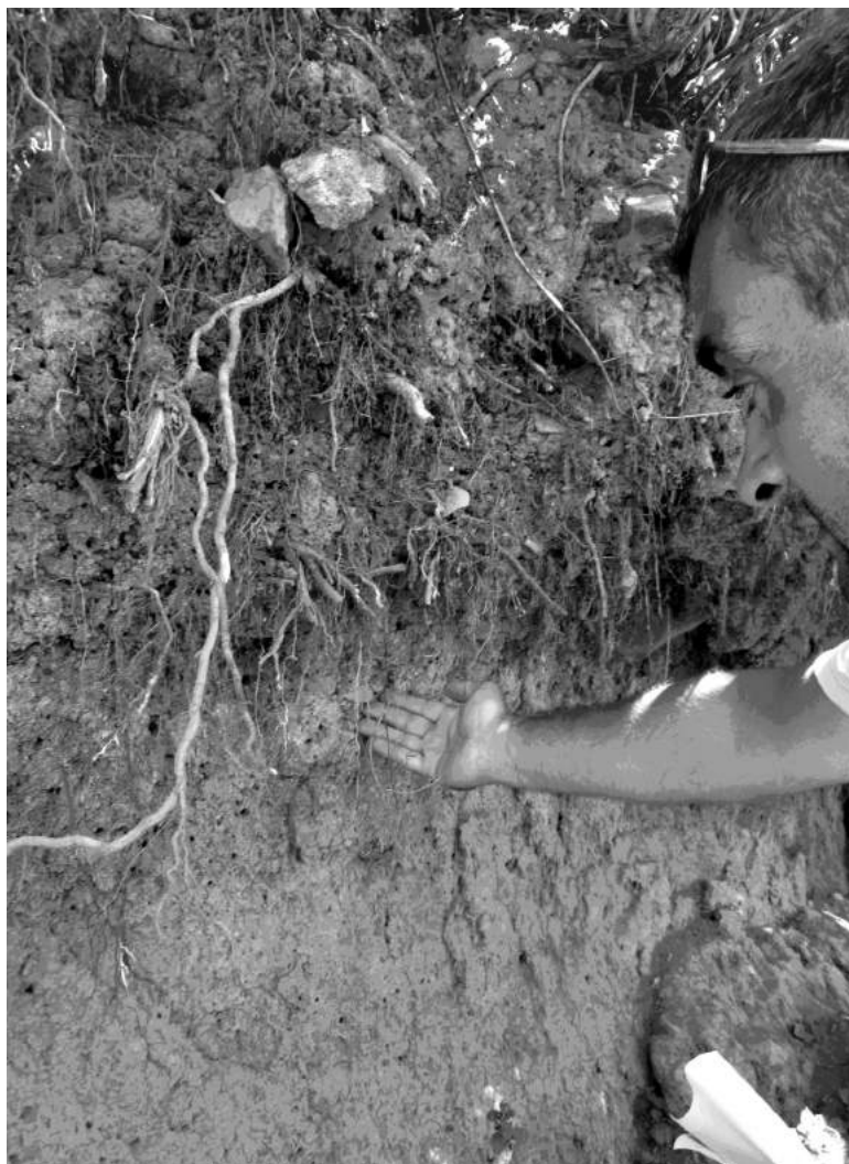
Рис. 4. Деражнянський замок. Культурний шар у валу (Фото)

Деражнянський як і ярмолинецький замки потребують невідкладного проведення пам'ятко-охоронних заходів, оскільки розташовані на приватних садибах і у будь-який час можуть бути остаточно зіпсовані гос-