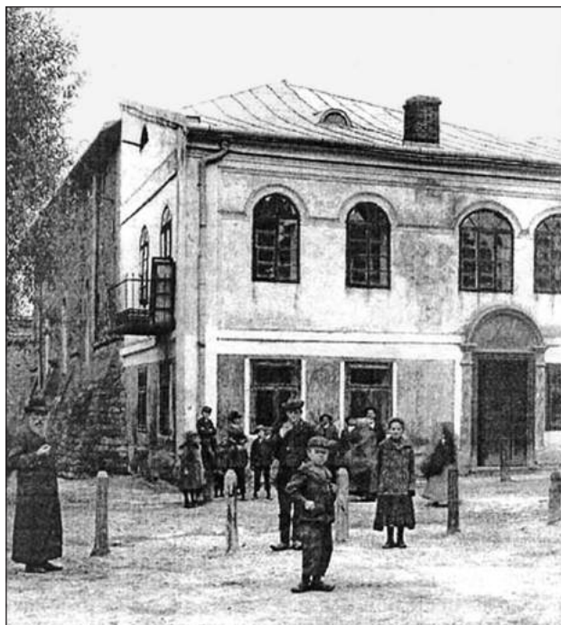
Мурована синагога в Золочеві

Татарські і турецькі набіги спустошували східні креси Речі Посполитої, тобто землі теперішньої України: Волинь, Галичину і Поділля. Реалії диктували і визначали потребу у пристосуванні під оборонні потреби не лише замків, але й церков, костелів і синагог. Процес інкастеляції (пристосування сакральних споруд до оборони), властивий усім європейським країнам, активно охопив і українські терени. Під час збройних