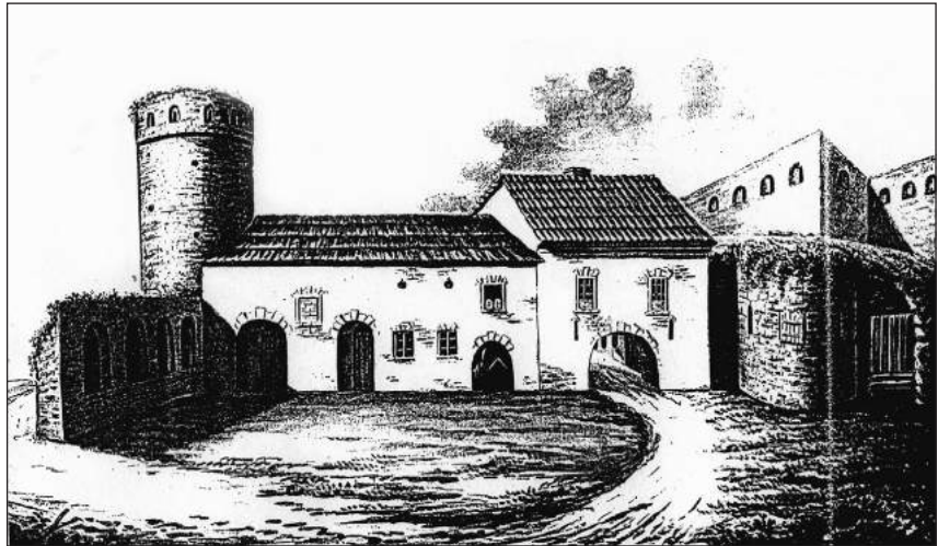
Рис. 2. Руська брама

Первісні укріплення Руської брами були побудовані в 15 ст. і захищали в'їзд в місто з південно-західного боку. В історичній літературі 19 ст. існувала версія, що укріплення були побудовані коштом руською громади міста і утримувалися нею. Літературні джерела подають інформацію, що модернізацію комплексу Руської брами здійснив в 1530-х рр. італійський фортифікатор Камілус, який в цей час був «начальником кам'янецьких фортифікацій» [7, с. 202]. Комплекс включав вісім оборонних башт та 250 метрів