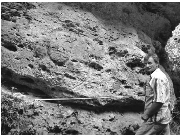
Рис. 1. Зображення личини на кам'яному валуні в ур. Кирнички біля с. Городок

Втім, що поряд з писемністю використовувалася знакова передача інформації, маємо аналог із давньоруського поховання у літописному Василеві. Так, на протилежному, правому березі Дністра розташоване село Василів Заставницького р-ну Чернівецької обл. На місці цього населеного пункту в давньоруський час знаходилося літописне місто Василів. Зокрема, при археологічних дослідженнях залишків фундаменту Успенської церкви було виявлено і досліджене поховання у кам'яному саркофазі. В ньому знаходився кістяк чоловіка віком 50-60 років. Зверху саркофаг перекривала кам'яна плита, на зглажені поверхні якої були вирізані геометричні знаки – своєрідний надмогильний напис. Так, знак у вигляді писаних один в один й трьох квадратів – «вавілон» – є символом зодчої мудрості і означає, що в гробниці поховано будівничого, архітек-